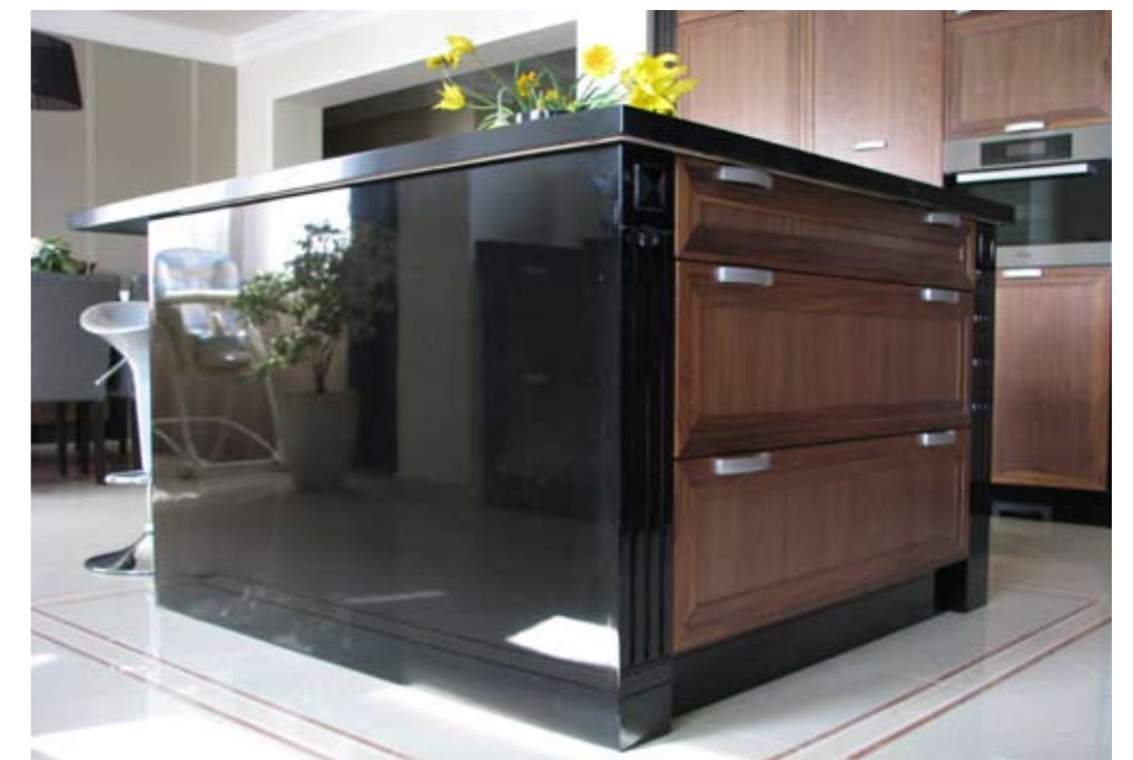
Fényes fekete MDF és diófa kombináció egy békéscsabai konyhában

Tölgyfa kirakati portál, faragott díszekkel Budapesten, a Kertész utca 37.-ben