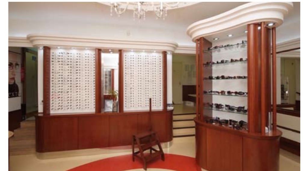
Pácolt bükk bútorok a bajai LASERFÉNY optikában

Weboldalunkon megtekinthető, kiemelt referenciáink között szerepel továbbá a Semmelweis Orvostudományi Egyetem Üllői úti előadójának teljes felújítása, valamint egy bajai optikai üzlet berendezése.