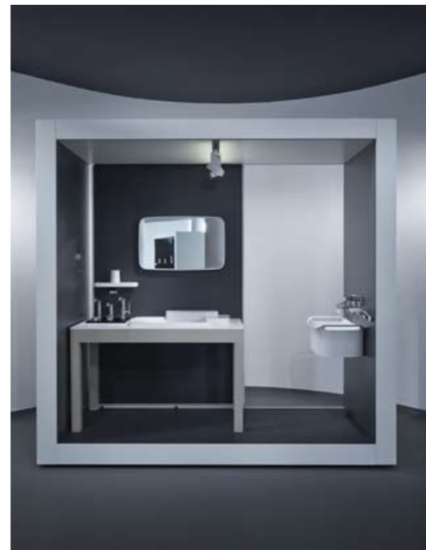
Axor Bouroullec az AquaMartban

A 13. kerületi AquaMartban található Axor Bouroullec Playtable segítségével mindenki maga találhatja ki, melyik legyen az ideális megoldás, amely esztétikailag is megfelel az elvárásainak, és a tér adta lehetőségeket is optimálisan használja ki. A játszóasz-